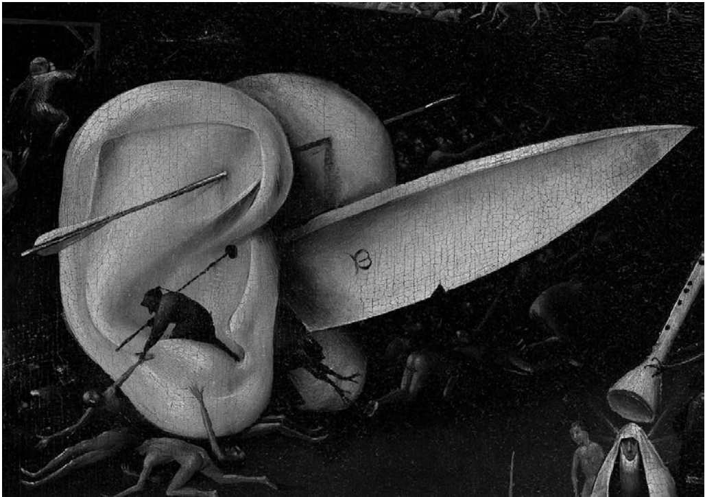
Detalle de "El jardín de las delicias" (1503-1515), El Bosco.