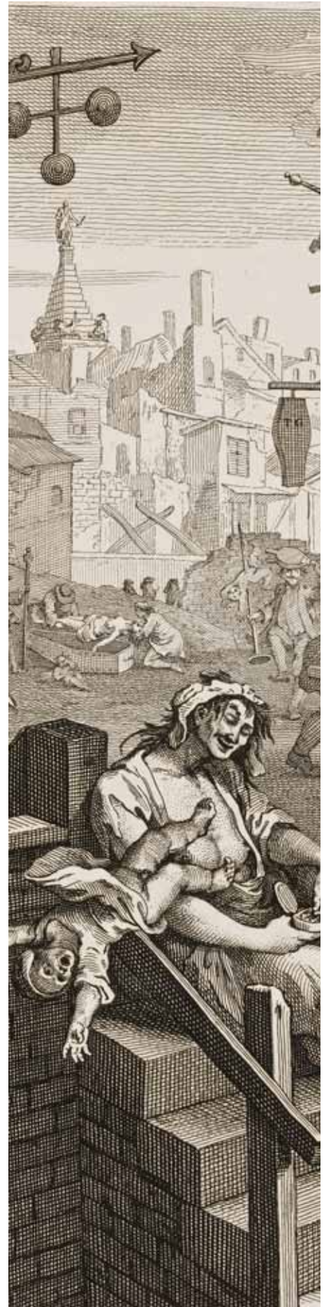
W. Hogarth, Gin Lane (detalle)