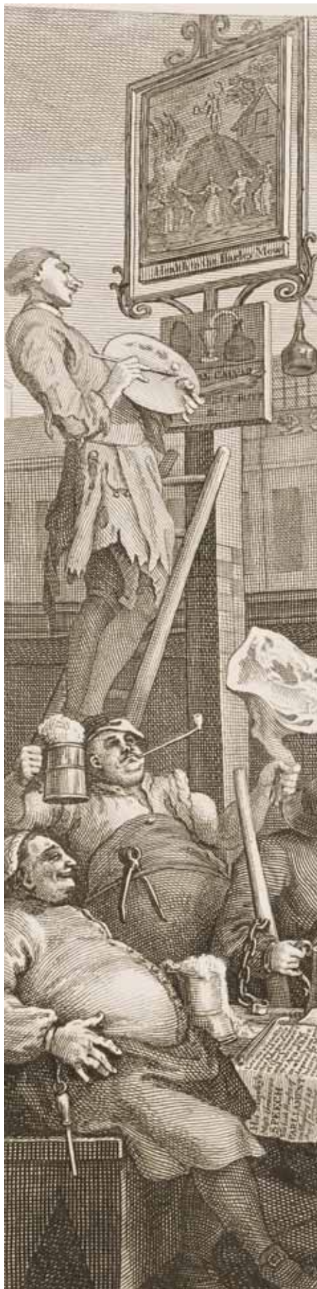
W. Hogarth, Beer Street (detalle)