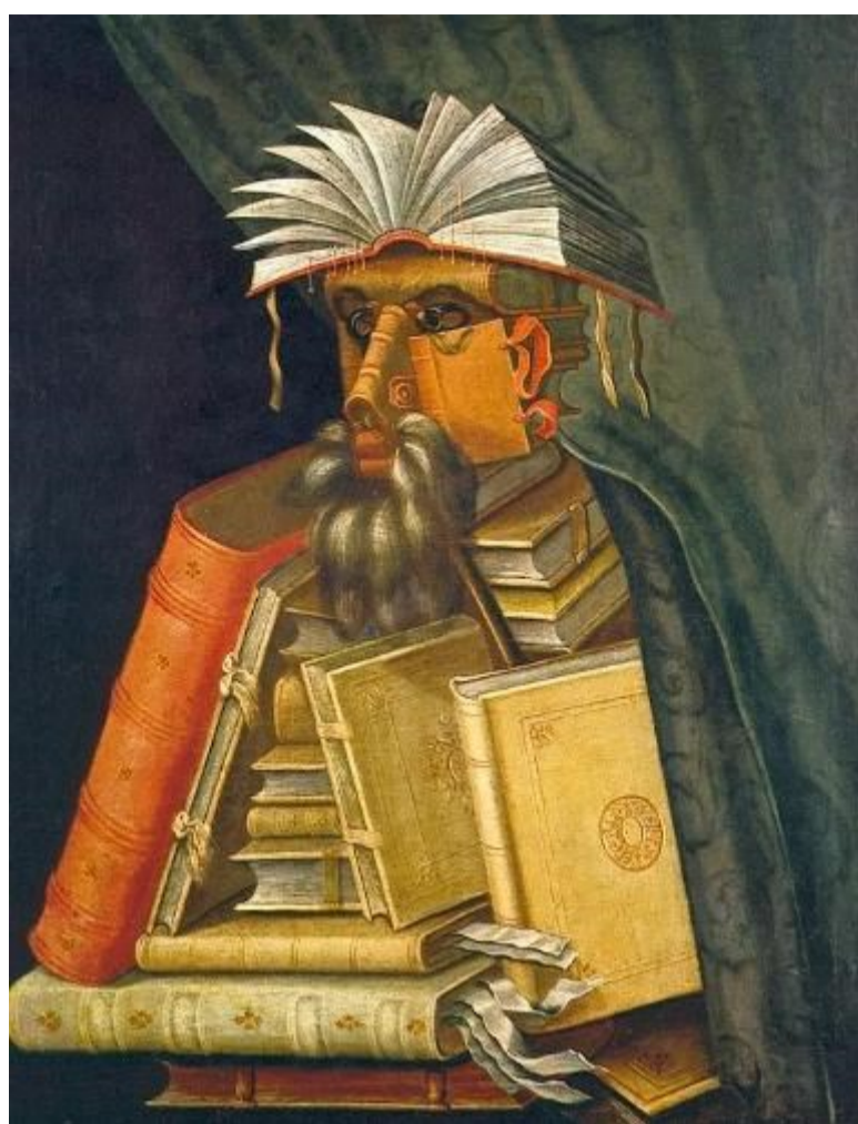
Giuseppe Arcimboldo, El bibliotecario (1566)